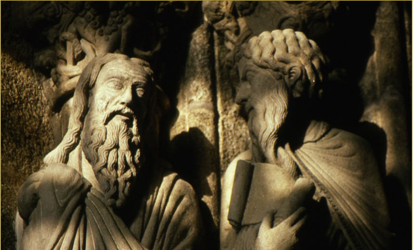
Heilige im Portico Della Gloria, Kathedrale von Santiago de Compostela, Spanien (RI)

Woran denken Sie, wenn Sie an „Aller-heiligen“ denken? Für Familien und jüngere Menschen ist es nun schon seit längerer Zeit eine kleine Ferienzeit, die Möglichkeit, eine letzte Woche Urlaub zu machen. Für viele andere ist es der nachmittägliche Besuch der Friedhöfe, das Gedenken an den Gräbern der eigenen Verstorbenen. Und eine kleinere Gemeinschaft trifft sich vormittags in den Kirchen zu feierlichen Gottesdiensten, um aller Heiligen der Kirche zu gedenken. Ein Fest unter vielen. Doch für mich steckt hinter Allerheiligen noch viel mehr, eine besondere Perspektive auf das Geheimnis des Lebens und der Kirche. Das ist mir vor 36 Jahren auf den letzten Metern unserer Wallfahrt nach Santiago de Compostela aufgegangen. Und das ging so: